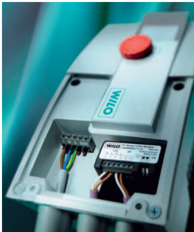
Integrierte Interface (IF)-Module in den Pumpen ermöglichen universelle, zeitgemäße Lösungen für die Einbindung von Pumpen in die Gebäudeautomation.

Immer mehr Eigentümer und Investoren, Planungsingenieure und Berater setzen auf die offenen Gestaltungsmöglichkeiten des „Weltstandards“