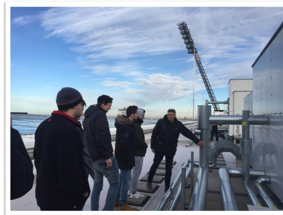
Lüftungsanlage Steigerwaldstadion Erfurt M2: Messen, Fehlersuche in Anlagen